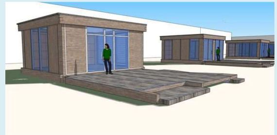
Figura 1: Prototipi in legno a impatto ambientale zero

Con il Progetto di Cooperazione Interregionale per l'innovazione sostenibile , è stato attivato un mix di iniziative propedeutico a creare un terreno fertile sul quale le imprese venete e sarde si potessero incontrare. Un esempio di successo è il progetto Innolegno , avviato nell'ambito del bando dedicato a fornire aiuti finanziari direttamente alle aziende. L'iniziativa s'ispira alle tradizioni materiche e costruttive dei partner veneti e sardi, il modello di business della rete pone al centro il legno quale mezzo che rende possibile la ricerca di soluzioni sostenibili, l'attenzione dei confronti delle risorse, il raggiungimento di risultati tangibili con metodi economici e, contemporaneamente, la ricerca della bellezza. La fase esecutiva del progetto prevede la progettazione e sperimentazione di montaggio e smontaggio di elementi strutturali e impiantistici per allestimenti di interni, e la predisposizione di prototipi di piccoli edifici a impatto ambientale zero, montabili e smontabili, destinati a show room, esercizi commerciali temporanei, spazi tecnici e di servizio, ecc., da allestire in luoghi aperti e vincolati paesagisticamente.